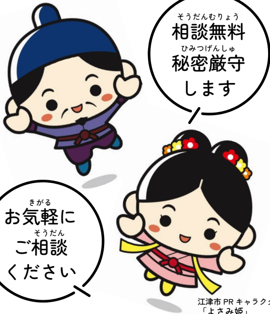
江津市PRキャラクター 「よさみ姫」